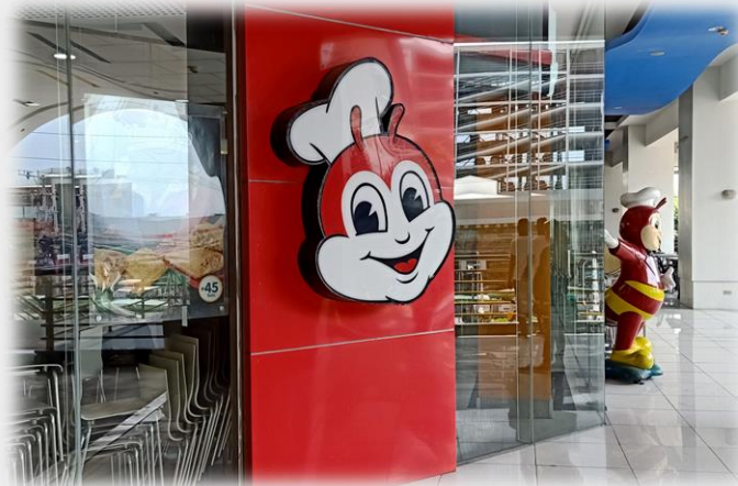
ジョリビー (ファーストフード店)