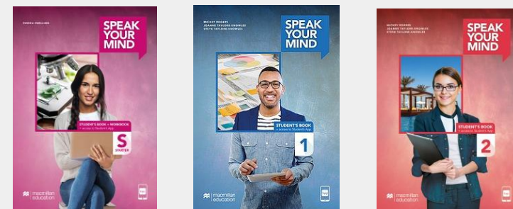
ジェネラルコース

③すべてのコースはACCESSメソッド (Activity Context Content Evaluation Supplementation Summary) を使用します。このメソッドは、コミュニケーション教育を促進し、学生が学習した言語を実生活に関連する有意義な方法で練習できるように設計されています。