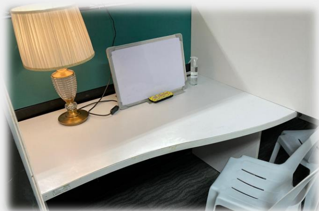
マンツーマンブース