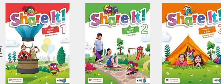
ファミリーコース (お子様向け)