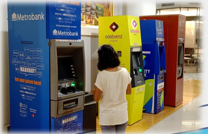
ATM (国際キャッシング可)