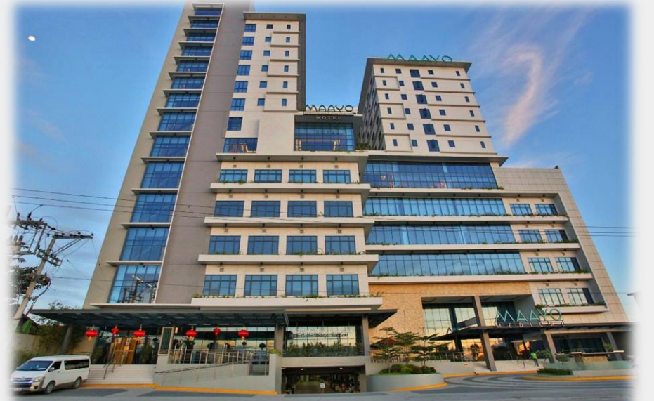
左側：Maayoホテル 右側：Maayo病院

また、ホテル内には2つのレストラン、2つのカフェ、ジム、屋上にはインフィニティプールがあります。フロントデスクでは、周辺の観光情報の案内、その他のニーズへの対応をしています。