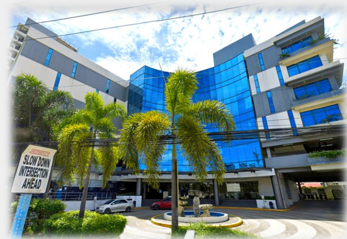
Northpark Campus 2023年1月移転

また、徒歩圏内にデパートが入るショッピングモールがあり、様々なショップ等を眺めながら楽しんで学びにつながる留学が可能となりました。